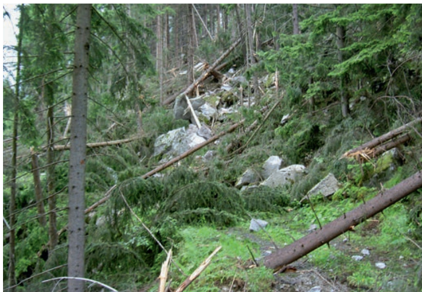
Abb 1 Die Hauptmasse des Sturzmaterials wurde beim Felssturz von 2006 in Gurnellen im Wilerwald abgelagert. Gemäss Thali (2006) wurden 75% der 8-m 3 -Steine und 20% der 20-m 3 -Steine vom Wald zurückgehalten. Die Energiereduktion durch den Wald bei einem 50-m 3 -«Stein» betrug hingegen lediglich rund 15%.

Obwohl im Titel des NaiS-Anforderungsprofils nur von Steinschlag gesprochen wird, gilt dieses auch für Blockschlag und sogar Felsstürze. Gemäss Definition von BRP et al (1997) treten bei Steinschlag Steine mit Durchmessern bis 0.5 m auf und bei Blockschlag Blöcke mit Durchmessern von 0.5 m bis zu einem Volumen von 100 m 3 . Bei grösseren Volumen wird von Felssturz gesprochen. Zur Vereinfachung verwenden wir in diesem Artikel den Begriff Steinschlag für alle relevanten Sturzgefahrenprozesse und den Begriff Stein für alle Sturzkomponenten, unabhängig von ihrer Grösse.