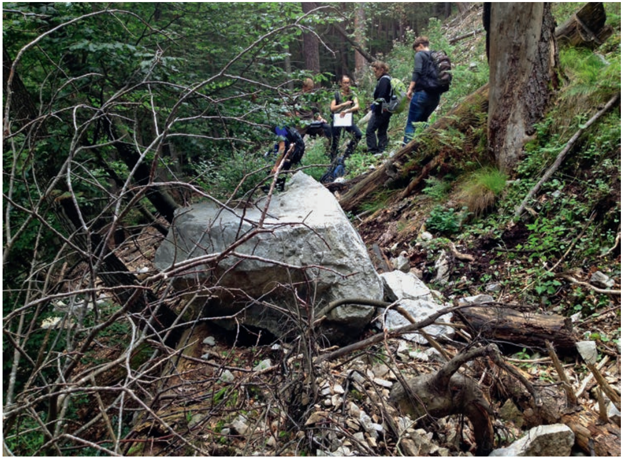
Abb 3 Dieser 1 m 3 grosse Stein wurde von einem alten liegenden Stamm im Salzacherwald (Merligen BE) gestoppt. Die übrigen Splitter (mehrere bis zu 0.5 m 3 ) wurden alle von stehenden Bäumen aufgehalten.

nis zu leisten vermag. Eine gute Datengrundlage ist die Voraussetzung für gute Ergebnisse bei der Berechnung der Schutzwirkung.